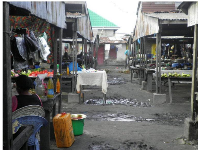
Cas de Dantokpa