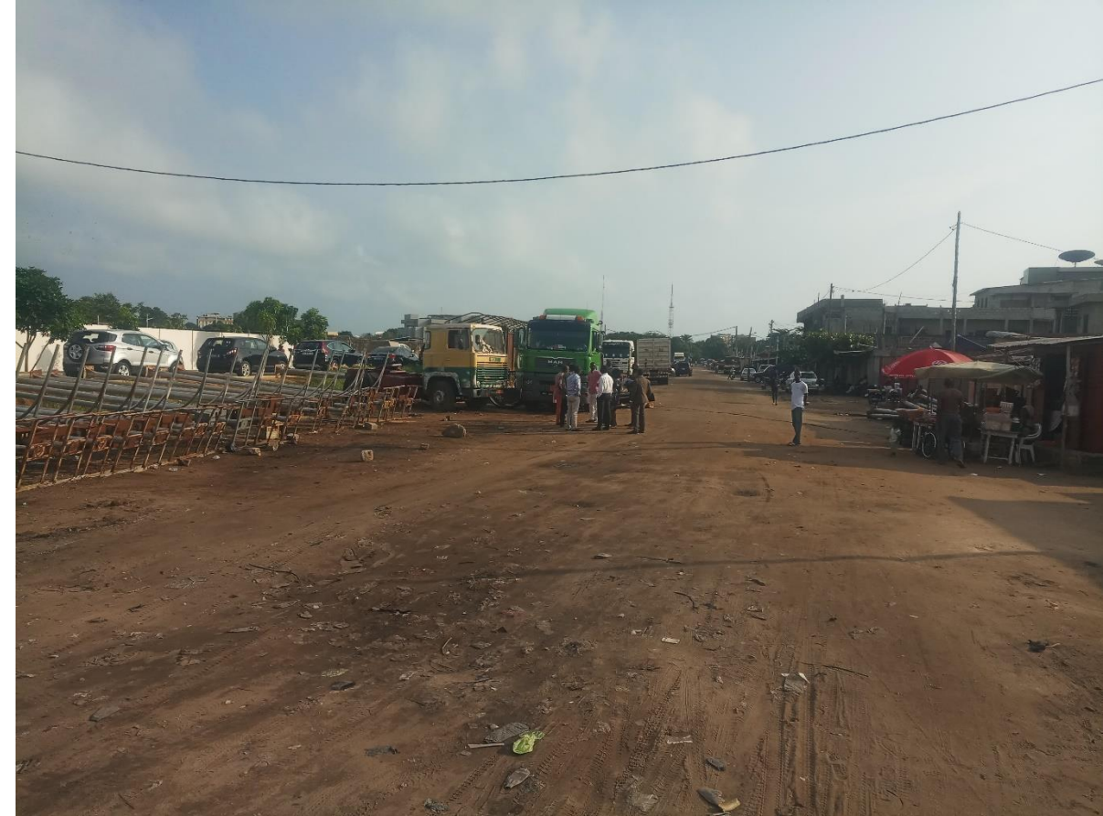
■ Marché de Gbégamey : Terre plein central en face du centre de Transfert Camp Guézo