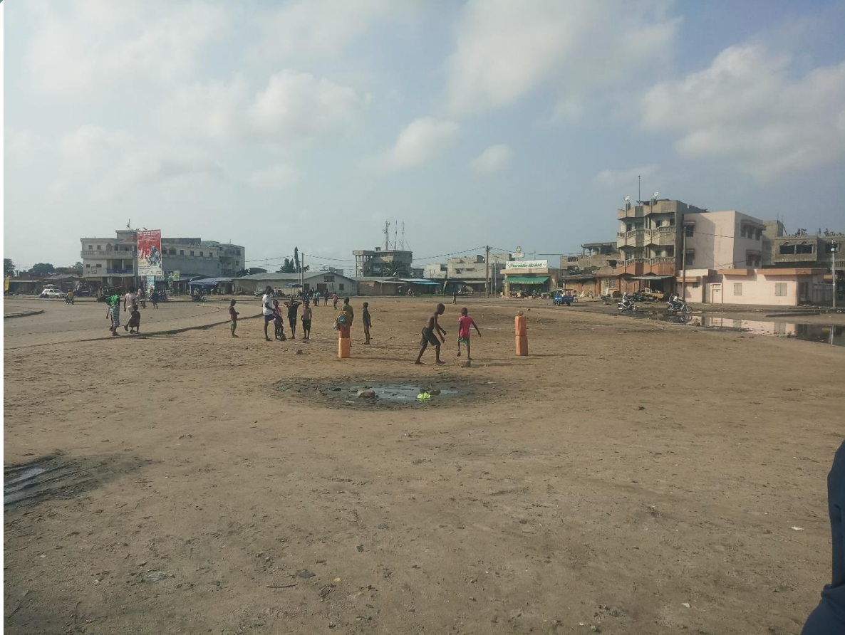
■ Marché de Aidjèdo : Grand carrefour St Cécile