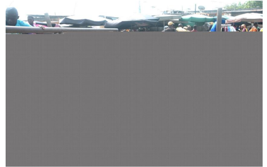
Cas de Dantokpa